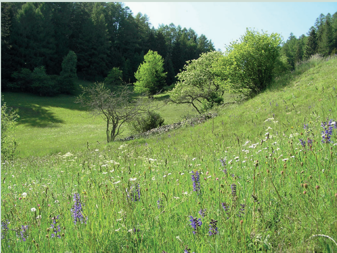
Strukturreiche Landschaft, mit genügend Blütenangebot, Steinhäufen, Einzelbäumen und Hecken

Unsere Felder sind mehr als nur Anbauflächen: sie sind auch ein Zuhause für eine bunte Vielfalt an Tieren und Pflanzen. Doch durch die moderne Landwirtschaft hat sich die Landschaft in den letzten Jahrzehnten stark verändert: Mechanisierung, Flächenzusammenlegungen und Intensivierung führen dazu, dass wichtige Lebensräume verloren gehen. Wo früher unterschiedliche Nutzungsformen und vielfältige Strukturen die Artenvielfalt förderten, dominieren heute oft monotone Grünflächen.